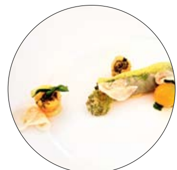
... auch auf dem Teller.

☞ schaufenster.diepresse.com/geschmacksfrage