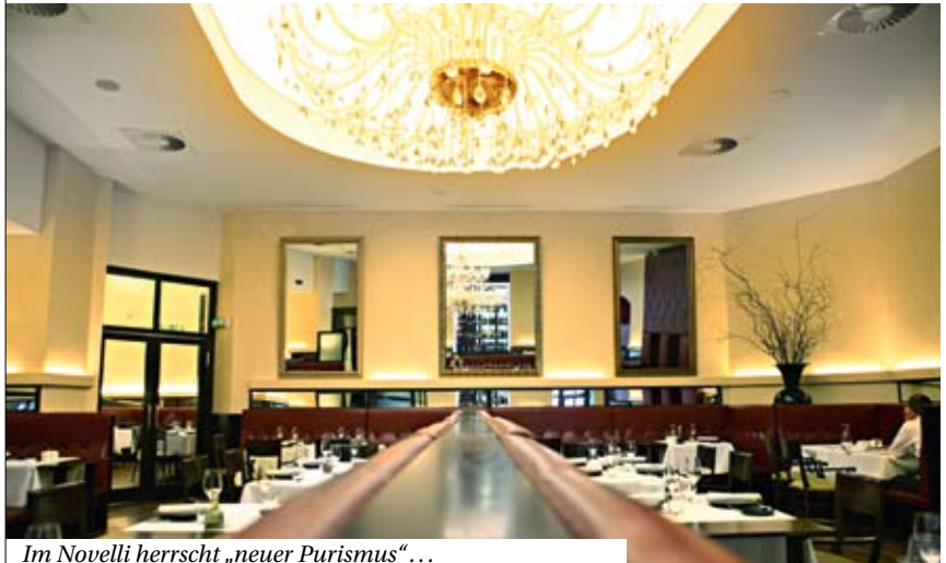
Im Novelli herrscht „neuer Purismus“...