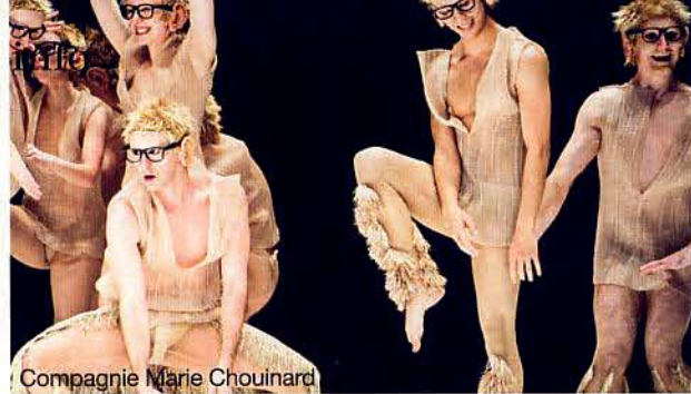
Compagnie Marie Chouinard

Auch heuer bringt das 27. „ImpulsTanz“-Festival virtuoseren zeitgenössischen Tanz nach Wien. Vom 15. Juli bis 15. August werden internationale